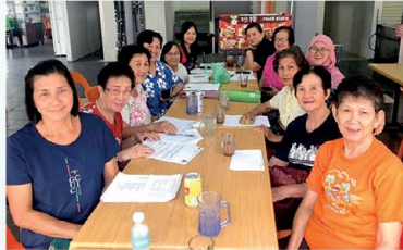
▲ PPWS Cawangan Simanggang Town