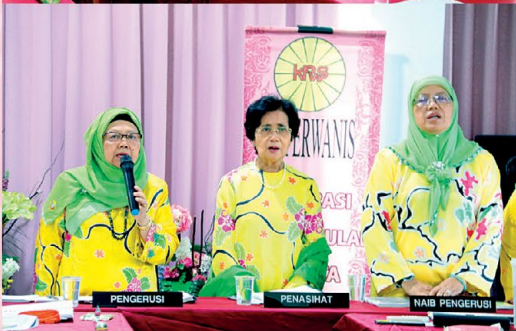
Nyanyian Lagu PPWS dimulakan sebelum mesyuarat bermula