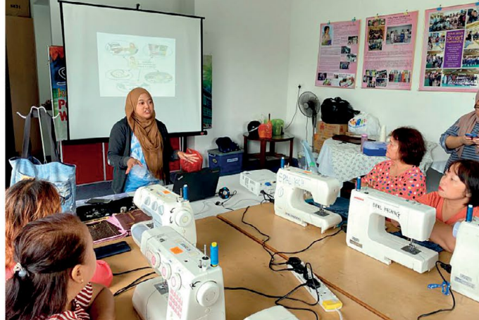
▲ Sesi taklimat disampaikan oleh wakil dari EPAL

Seramai 20 orang peserta dalam kalangan ahli PPWS menyertai program ini dan tempat program ialah di Bangunan Ibu Pejabat PPWS, Jalan Green, Kuching.