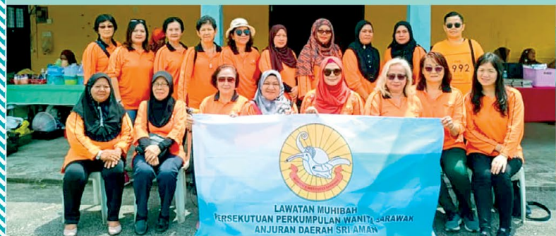
▲ Lawatan ke Sematan