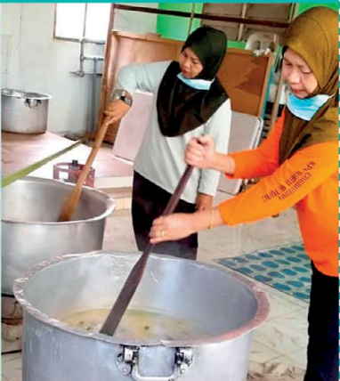
▲ 2 orang ahli dari PPWS Cawangan Kampung Baru Betong sedang memasak bubur asyura untuk agihan kepada penduduk kampung