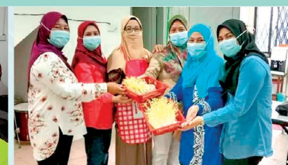
Para peserta menunjukkan hasil tanaman tauge masing-masing