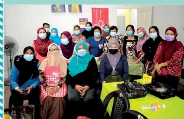
Gambar kenangan kepada semua peserta bengkel

Bengkel Penanaman Tauge anjuran Agrotech Academy Serian telah dihadiri oleh ahli-ahli PPWS dari Kampung Hulu Serian selain Wanita AIM Serian, Biro Wanita Kampung Hulu Serian. Diharap bengkel ini memberi manfaat kepada wanita-wanita yang telah menghadirinya.