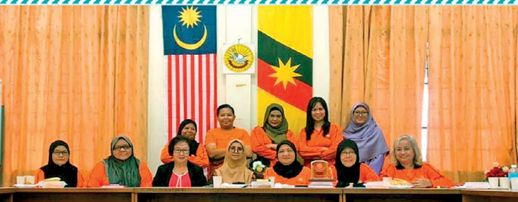
▲ Mesyuarat Perjumpaan Tahunan PPWS Daerah Sri Aman Tahun 2020 telah diadakan pada 7 Januari 2020. Mesyuarat telah dihadiri oleh seramai 18 orang ahli. Mesyuarat ini diadakan untuk membentangkan laporan aktiviti dan laporan kewangan.