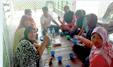
▲ PPWS Cawangan Kpg Hulu Lingga