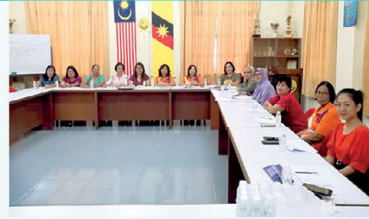
▲ PPWS Cawangan Kpg Perintah