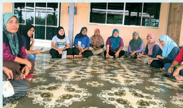
▲ PPWS Cawangan Bakong