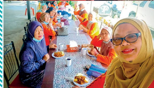
◀ Ahli-ahli dari PPWS Cawangan Pusa sedang menjamu selera setelah mesyuarat Cawangan selesai diadakan