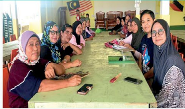
▲ PPWS Cawangan Agropolitan Seduku