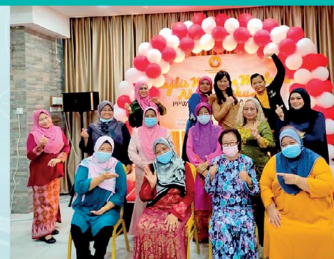
▶ Majlis Makan Malam ini diadakan untuk memberi penghargaan kepada Jawatankuasa PPWS Daerah Sri Aman bagi Sesi 2018-2020 atas komitmen ahli-ahlinya menjayakan aktiviti atau program sepanjang tahun. Selain itu, majlis ini turut diadakan bagi merayakan Tahun Baru 2021.