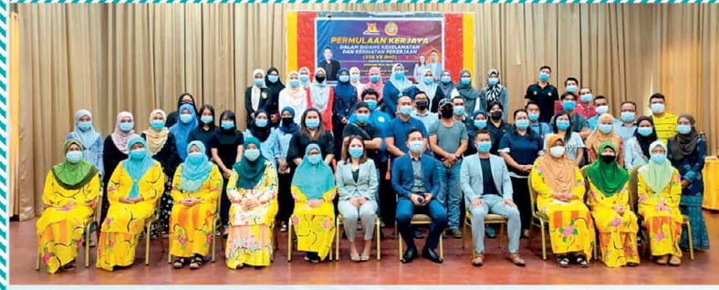
▲ Program Ceramah Permulaan Kerjaya Dalam Bidang Keselamatan Dan Kesihatan Pekerjaan Anjuran Bersama PPWS Kawasan Limbang Lawas Bersama Kenyalang WCCT Sdn Bhd