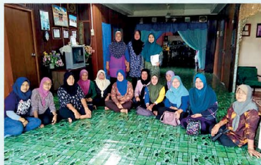
▲ PPWS Cawangan Sesang & Kabong