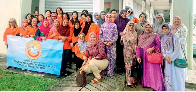
▲ Lawatan ke Ibu Pejabat PPWS, Kuching