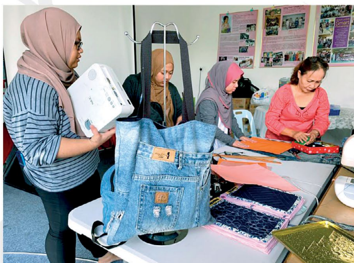
▲ Contoh beg jeans yang dihasilkan untuk rujukan peserta