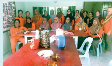
▲ PPWS Cawangan Meludam