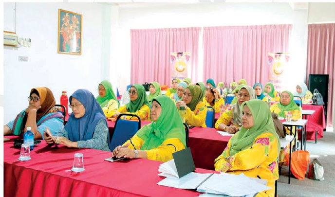
▲ Peserta mendengar dengan tekun taklimat yang disampaikan

Program yang sama akan dilaksanakan di 5 Kawasan PPWS seluruh Sarawak iaitu di Kuching, Sri Aman, Sibul, Miri dan Limbang.