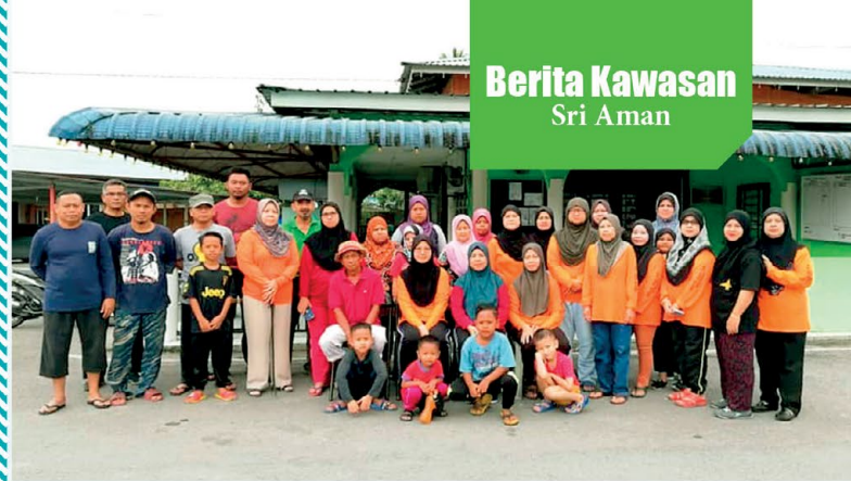
▲ Program Gotong Royong Cegah Denggi telah diadakan pada 15 Februari 2020. Program ini dianjurkan oleh PPWS Cawangan Kampung Baru, Betong di sekitar kampung mereka. Seramai 12 orang ahli menyertai program ini.