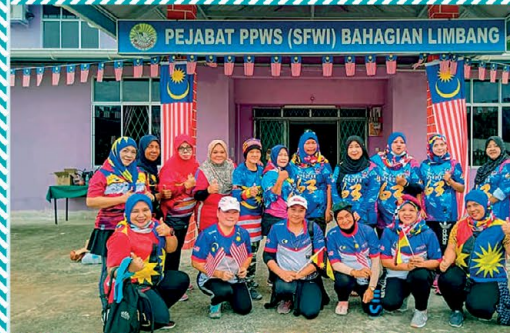
◀ Sambutan Hari Malaysia PPWS Daerah Limbang Pada 16 September 2020