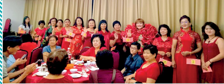
▲ Jamuan Makan Malam Sempena Tahun Baru Cina telah dianjurkan oleh PPWS Cawangan Simanggang Town pada 2 Februari 2020. Seramai 40 orang ahli telah hadir memeriahkan program ini.