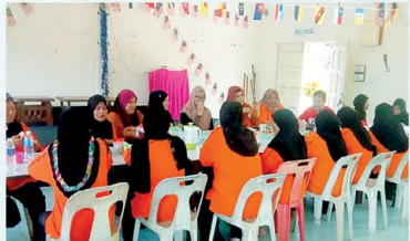
▲ PPWS Cawangan Stumbin