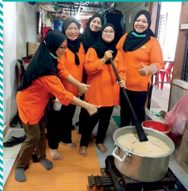
▲ 5 orang ahli PPWS Cawangan Kampung Lemanak telah bergotong-royong memasak bubur cha cha sempena menyambut Hari Kebangsaan. Aktiviti telah dihadiri oleh seramai 15 orang ahli PPWS