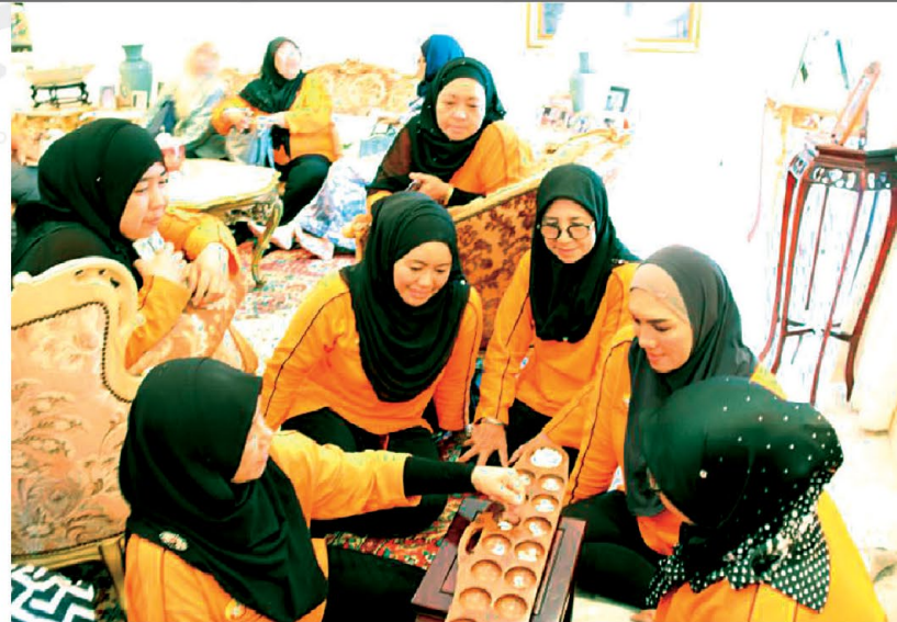
▲ Ahli-ahli meluangkan masa bermain congkak sementara menunggu jamuan tengah hari disajikan