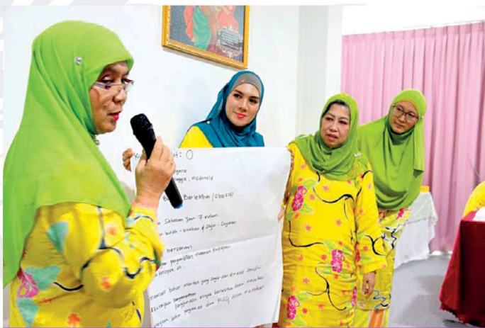
◆ Sesi pembentangan kumpulan berkenaan dengan tingkah laku pemakanan masing-masing yang perlu diubah ke arah lebih sihat