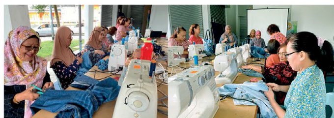
◆ Peserta kelas jahitan mula menggantung fabrik jeans yang dibawa oleh mereka masing-masing