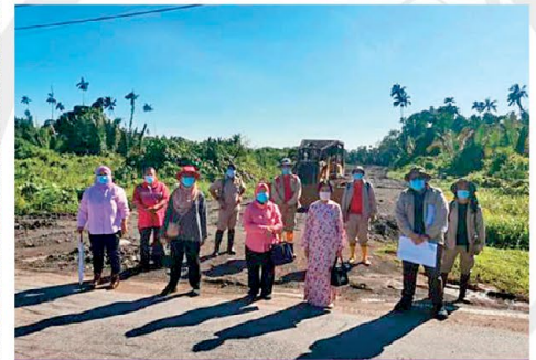
▲ Gambar kenangan di tapak tanah baru PPWS di Samariang bersama pihak Jabatan Tanah dan Survei, Kuching