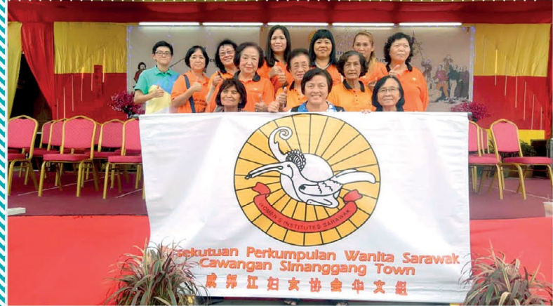
▲ PPWS Cawangan Simanggang Town telah menyertai Perarakan Chap Goh Mei pada 8 Februari 2020 di Tokong Sri Aman. Seramai 16 orang ahli menyertai perarakan ini.