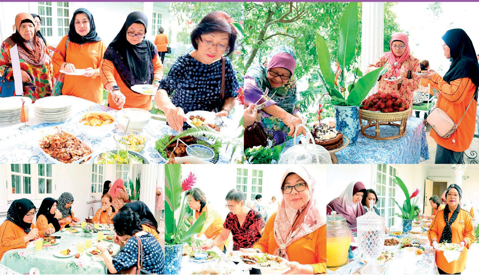
▼ Gambar ahli-ahli PPWS menjamu selera di kediaman Penasihat PPWS