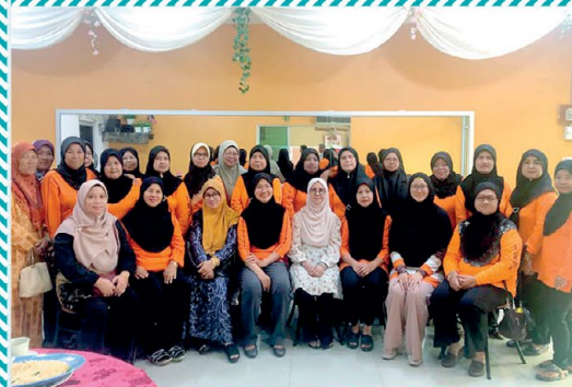
◀ Majlis Santai Hi-Tea telah dianjurkan oleh PPWS Cawangan Kampung Baru, Betong di kafe JR Betong pada 21 Februari 2020. Seramai 25 orang ahli PPWS telah menyertai jamuan ini.