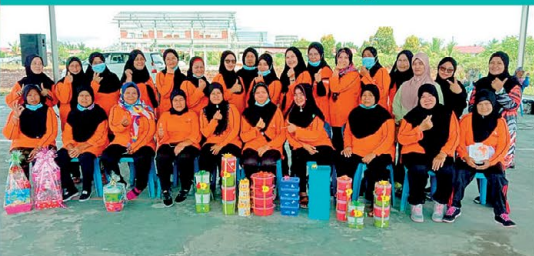
◀ Seramai lebih kurang 30 orang ahli memeriahkan Program Kemerdekaan yang dianjurkan oleh PPWS Cawangan Agropolitan Seduku