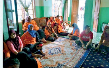
▲ PPWS Cawangan Kpg Tengah Lingga