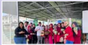
Ahli-ahli PPWS Bintulu/Tatau bersama pihak TOCLAN Borneo

PPWS Daerah Bintulu/Tatau telah mengadakan lawatan ke tempat penanaman fertigasi dan hidroponik di Kuching. Tujuan lawatan ini untuk mendapatkan tambahan ilmu bagi menyokong usaha ahli-ahli PPWS Bintulu/Tatau dalam penanaman kebun dapur di bangunan PPWS. Ibu Pejabat PPWS telah membantu menyelaras lawatan mereka dengan pihak HFE Agro dan TOCLAN Borneo.