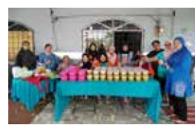
Perkumpulan Kampung Melayu Roban 14 April 2022