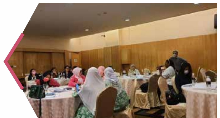
Peserta-peserta yang hadir dalam kursus tersebut dalam kalangan ahli-ahli NCGO dan persatuan lain