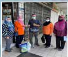
Perkumpulan Penguais menyampaikan sumbangan kepada Persatuan Cina Muslim Cawangan Sarawak

Aktiviti sepanjang bulan puasa yang telah diadakan oleh Perkumpulan PPWS.