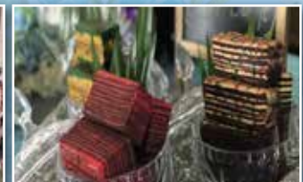
Dua jenis kek lapis yang diajar semasa kelas dijalankan