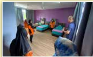
Ahli-ahli PPWS dibawa melihat asrama anak yatim di kompleks tersebut