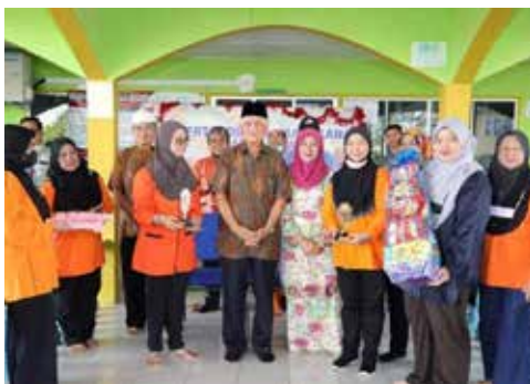
Salah seorang penerima hadiah Saguhati pertandingan

Seramai 8 peserta telah mengikuti pertandingan tersebut. Acara mewarna dan menganyam ketupat juga turut diadakan bagi memeriahkan lagi program ini.