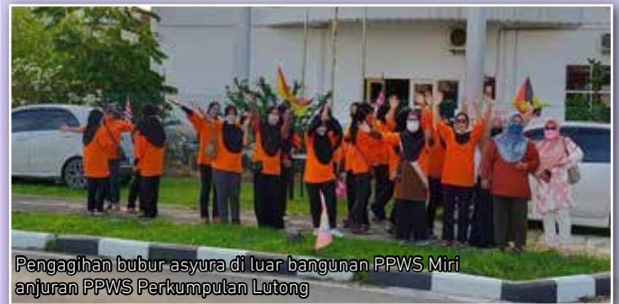
Pengagihan bubur asyura di luar bangunan PPWS Miri anjuran PPWS Perkumpulan Lutong