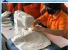
Tenaga pengajar sedang menunjukkan satu persatu cara menjahit beg untuk mudah diikuti peserta bengkel