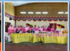
Ahli-ahli Pink Ribbon Support Group Kuching turut serta dalam program