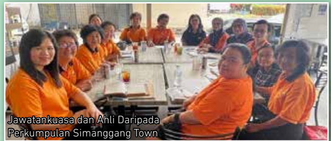
Jawatankuasa dan Ahli Daripada Perkumpulan Simanggang Town