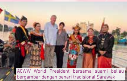
ACWW World President bersama suami beliau bergambar dengan penari tradisional Sarawak