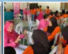
Sesi soal jawab mengenai penyakit Kanser Payudara