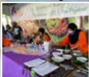
Peserta daripada Perkumpulan Sri Arjuna sedang membuat persiapan untuk menghias menu yang dipertandingkan