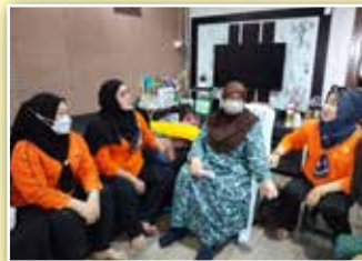
Salah seorang ahli PPWS yang telah menerima sumbangan ikhlas PPWS ini