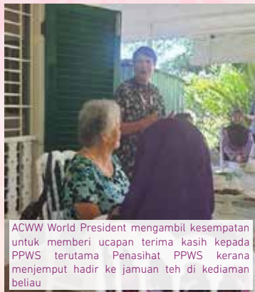
ACWW World President mengambil kesempatan untuk memberi ucapan terima kasih kepada PPWS terutama Penasihat PPWS kerana menjemput hadir ke jamuan teh di kediaman beliau