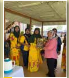
Pengerusi Negeri PPWS menerima cenderahai daripada Pengerusi Perkumpulan Belawai