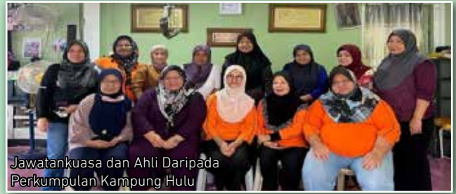
Jawatankuasa dan Ahli Daripada Perkumpulan Kampung Hulu