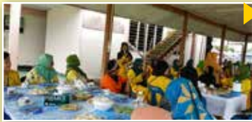
Pengerusi Negeri serta Ahli Jawatankuasa Induk PPWS dibawa beramah mesra dengan ahli-ahli PPWS di Perkumpulan Belawai selain belajar membuat suman