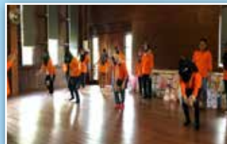
Aktiviti sukaneka "membawa buah kelapa menggunakan anggota paha"