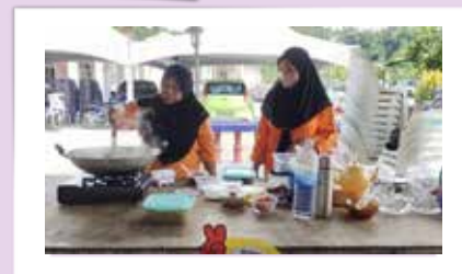
Salah satu kumpulan yang mengikuti pertandingan masakan