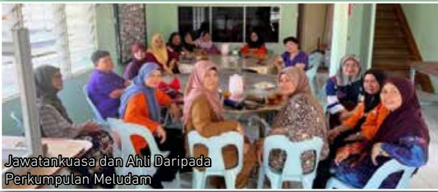
Jawatankuasa dan Ahli Daripada Perkumpulan Meludam