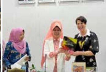
Gambar kenangan bersama rombongan PPWS dan pihak JWKS bersama ACWW World President