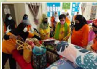
Produk yang dihasilkan ahli PPWS untuk dipamerkan kepada Jawatankuasa Cawangan