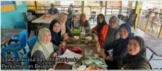
Jawatankuasa dan Ahli Daripada Perkumpulan Beladin.