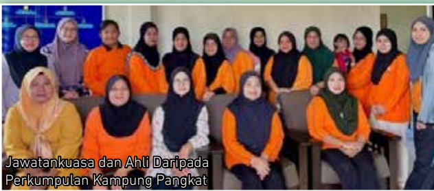
Jawatankuasa dan Ahli Daripada Perkumpulan Kampung Pangkat