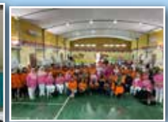
Ahli-ahli PPWS bersama ahli-ahli Pink Ribbon Support Group Kuching