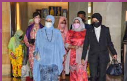
Ketibaan KDYMM Tuanku Permaisuri Agong di lobi hotel