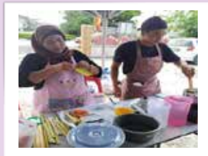
Peserta dari PPWS Daerah Sibul bersama anaknya menyertai pertandingan masakan