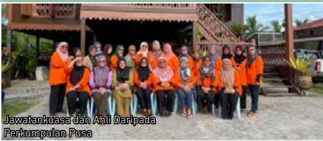
Jawatankuasa dan Ahli Daripada Perkumpulan Pusa