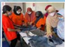
Peserta jahitan melihat hasil tangan beg-beg contoh yang telah dihasilkan oleh peserta bengkel yang mengikuti kelas ini sebelum ini

PPWS Daerah Kuching mengadakan Kelas Jahitan Membuat Beg Jeans di Bilik Seminar Ibu Pejabat PPWS, Kuching. Program ini dengan kerjasama UCSI University dan Worming Up! Kemahiran membuat beg jeans ini adalah salah satu usaha untuk menjaga kelestarian alam sekitar bagi mengurangkan penggunaan beg plastik dalam kehidupan seharian.