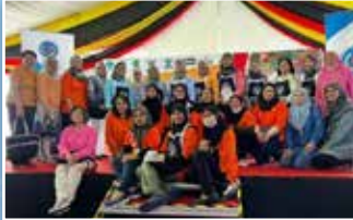
Gambar ahli-ahli PPWS bersama tetamu kenamaan yang hadir pada pagi tersebut

PPWS dijemput oleh Jabatan Wanita dan Keluarga Sarawak (JWKS) untuk membuat demonstrasi masakan Tumpik dan Lempeng Lemantak di Waterfront Kuching sempena Sarawak Kitchen - Sarawak Regatta. Demonsrasi masakan telah ditunjuk ajar oleh Perkumpulan Green.