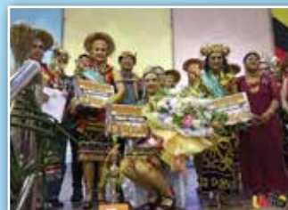
20 peserta dari pelbagai kaum dan etnik seperti Bidayuh, Melayu, Melanau, Iban dan juga Orang Ulu telah menyertai Pertandingan Mrs Etnik Persekutuan Perkumpulan Wanita Sarawak (PPWS) Daerah Serian.

Seramai 20 peserta dari pelbagai kaum dan etnik seperti Bidayuh, Melayu, Melanau, Iban dan juga Orang Ulu telah menyertai Pertandingan Mrs Etnik Persekutuan Perkumpulan Wanita Sarawak (PPWS) Daerah Serian.