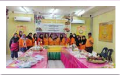
Para keluarga yang telah mengikuti pertandingan masakan

PPWS Cawangan Limbang/Lawas telah mengadakan Pertandingan Masakan ini pada 24 September 2022 di Pejabat PPWS Cawangan Limbang/Lawas. Seramai 8 pasangan telah menyertai pertandingan ini.