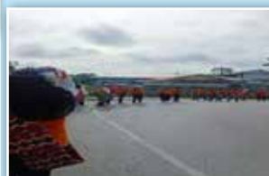
Ahli-ahli PPWS berjalan kaki di sekitar pekan Simunjan.

Program Walk of Love Simunjan 2022 anjuran PPWS Daerah Simunjan telah dihadiri oleh Yang Berhormat Dato Sri' Hajah Nancy Haji Shukri, Menteri Pelancongan, Seni dan Budaya Malaysia (MOTAC) merangkap Ahli Parlimen P200 Batang Sadong.