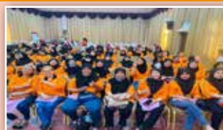
Seramai 130 orang ahli PPWS Daerah Limbang telah menghadiri Program Interaktif Bersama NGO-PPWS yang telah dirasmikan oleh Yang Berhormat Datuk Haji Hasbi bin Habibollah, Timbalan Menteri Pengangkutan Malaysia