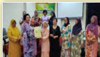
Salah seorang penerima cenderamata daripada JKK Sosial dan Rekreasi

Seramai 80 orang ahli PPWS telah hadir di majlis tersebut. Antara pengisian atur cara pada malam tersebut ialah acara memotong kek 60 tahun dan memberi sumbangan cenderamata kepada 15 orang ahli PPWS di Sibu yang banyak memberi sumbangan aktif dalam PPWS.