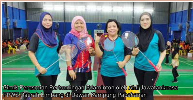
Gimik Perasmian Pertandingan Badminton oleh Ahli Jawatankuasa PPWS Daerah Limbang di Dewan Kampung Pabahanan