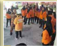
Turut berlangsung ialah Sesi Demonstrasi Pencegahan Kebakaran oleh Anggota Bomba Tanjung Manis untuk memberi tambahan ilmu keselamatan kepada ahli-ahli PPWS