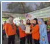
Salah seorang penerima hadiah saguhati pertandingan