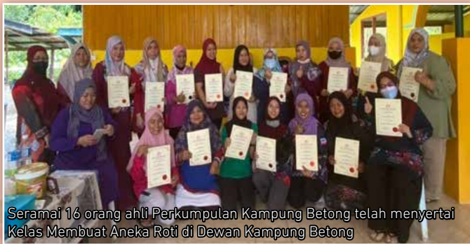
Seramai 16 orang ahli Perkumpulan Kampung Betong telah menyertai Kelas Membuat Aneka Roti di Dewan Kampung Betong