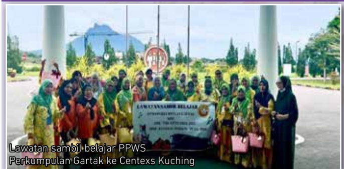
Lawatan sambil belajar PPWS Perkumpulan Gartak ke Centexs Kuching