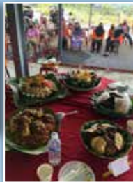
Hidangan Nasi Ambeng yang dipertandingkan