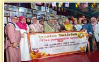
Ahli-ahli mengambil kesempatan bergambar di ruangan galeri Rosli Dhoby

Rombongan Perkumpulan Lutong, Miri telah membuat lawatan ke Galeri Rosly Dhoby dengan diiringi oleh ahli-ahli daripada PPWS Daerah Sibu serta Pengerusi PPWS Cawangan Sibu/Sarikei/Kapit.