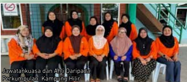
Jawatankuasa dan Ahli Daripada Perkumpulan Kampung Hilir