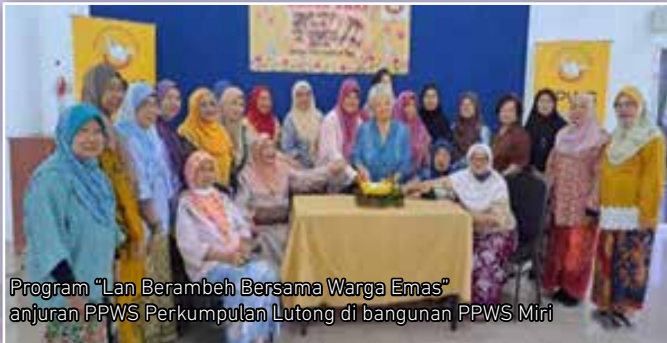
Program “Lan Berambah Bersama Warga Emas” anjuran PPWS Perkumpulan Lutong di bangunan PPWS Miri