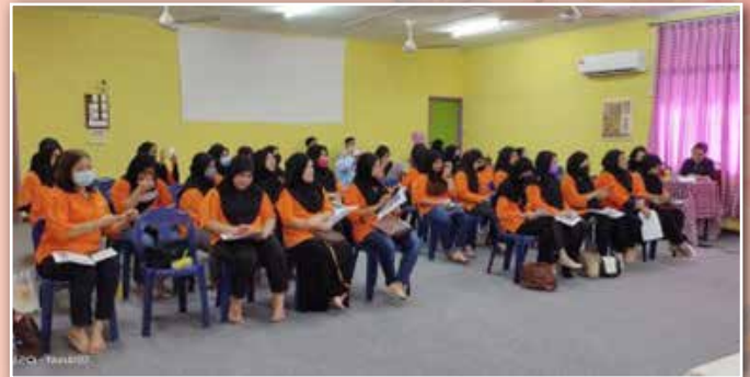
Para peserta yang mengikuti sesi ceramah

Demonstrasi Kek Lapis Premium anjuran Perkumpulan Kampung Belipat Lawas. Objektif program ini untuk memberi pendedahan dan tunjuk ajar kepada ahli di peringkat Perkumpulan kemahiran membuat kek untuk dijadikan sumber pendapatan