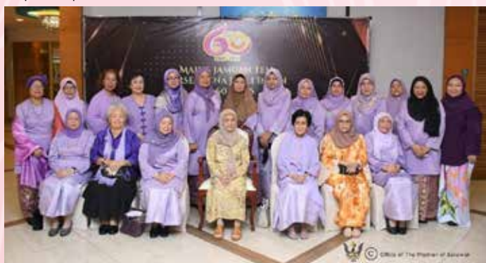
Ahli Jawatankuasa Induk PPWS Sesi 2021-2022 bersama Isteri Premier Sarawak merakam gambar kenangan sempena Majlis Jamuan Teh Sempena Jubli Intan Ke-60 PPWS