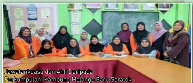
Jawatankuasa dan Ahli Daripada Perkumpulan Kampung Melango Baru Saratok