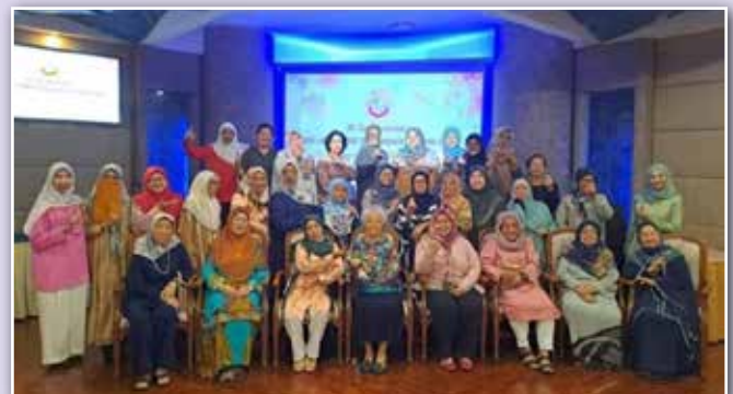
Ahli-ahli Piasau Link yang hadir di Majlis Apresiasi anjuran Perkumpulan Piasau Link