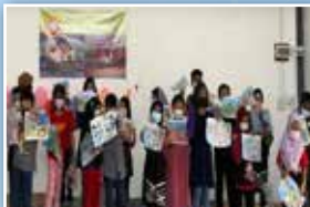
Peserta daripada golongan kanak-kanak sedang mempamerkan hasil mewarna mereka di atas pentas utama untuk dinilai oleh para juri

Perkumpulan Sri Arjuna mengadakan Program Berambek bertempat di Dewan Lestari Kampung Sri Arjuna. Pelbagai aktiviti dijalankan iaitu Pertandingan Membuat Nasi Ambeng, Pertandingan Gubahan Bunga Daripada Barangan Terpakai dan Pertandingan Mewarna Kategori Kanak-Kanak. Cabutan bertuah dan jualan meja juga diadakan. Tujuan program ini ialah untuk mengeratkan silaturahim bersama komuniti setempat.