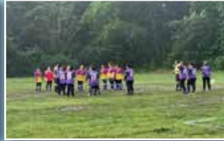
Pasukan bola sepak wanita sedang beraksi di padang