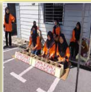
Persembahan muzik oleh ahli-ahli Perkumpulan Jerijeh untuk menyambut rombongan Jawatankuasa Induk PPWS