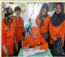
Pengerusi Negeri PPWS menandatangani buku pelawat di Rumah Perkumpulan Bandar Baru Tanjung Manis sambil diperhatikan oleh beberapa Jawatankuasa Induk PPWS lain