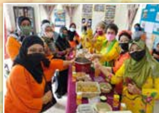
Jamuan yang dihidangkan kepada tetamu-tetamu yang hadir