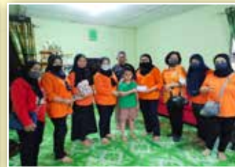
Salah seorang anak yatim yang terpilih menerima sumbangan melalui program ini