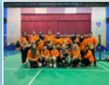
Ahli-ahli PPWS yang mengikuti pertandingan badminton ini