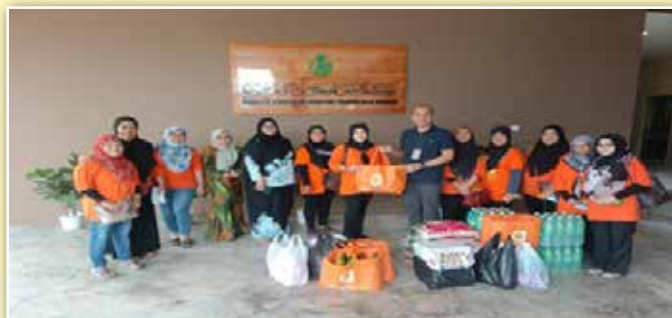
Sesi penyerahan sumbangan barangan makanan bagi keperluan anak yatim yang menginap di asrama

Persekutuan Perkumpulan Wanita Sarawak Perkumpulan Sibujaya telah menjayakan pemberian sumbangan keperluan kepada warga kompleks Kebajikan Juma'ani Tuanku Haji Bujang, Sibu. Seramai 52 orang anak yatim yang menginap di asrama mereka masih bersekolah.