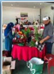
Peserta pertandingan sedang menggubah bunga