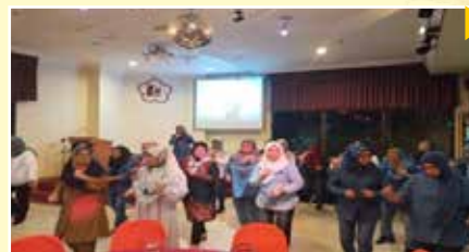
Persembahan tarian poco-poco oleh ahli PPWS Daerah Sibu