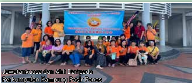
Jawatankuasa dan Ahli Daripada Perkumpulan Kampung Pasir Panas