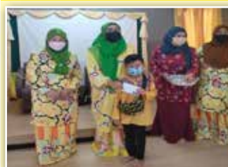
Sumbangan kepada salah seorang penerima anak yatim