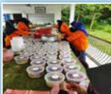
Perkumpulan Sri Arjuna membuat agihan air cendol dan kurma kepada penduduk kampung.