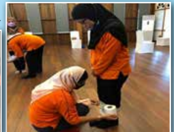
Aktiviti "Mumnia" turut diadakan dengan membalut rakan menggunakan tisu