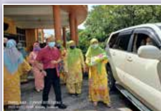
Yang Berhormat Datuk Talib Zulpilih merasmikan acara Flagoff program Infak Ramadan