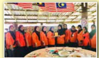
Sesi beramah makan di Restoren Ifitah, Belawai bersama rombongan lawatan