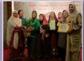
PPWS Daerah Bintulu/Tatau dinobatkan sebagai daerah terbaik bagi Cawangan Miri/Bintulu