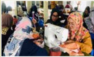
Ahli-ahli PPWS sedang tekun menjahit menggunakan mesin yang disediakan pihak penganjur

Seramai 45 orang ahli PPWS Perkumpulan Bandar Tanjung Baru Manis telah mengikuti kursus jahitan yang telah dianjurkan oleh Jabatan Wanita dan Keluarga Sarawak. Program bertempat di bangunan Perkumpulan Bandar Baru Tanjung Manis. Program ini memberi peluang agar wanita dapat bergiat dalam bidang jahitan untuk membantu mereka menjana pendapatan sampingan.