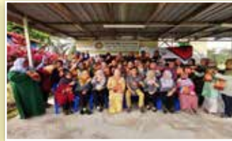
Ahli PPWS bersama kakitangan JWKS dan tenaga pengajar bengkel