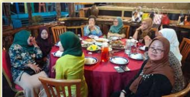
Tetamu di meja utama berpakaian mengikut tema batik dan mereka bersedia untuk menjamu selera