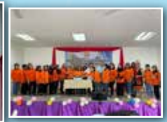
Jawatankuasa Perkumpulan Annah Rais serta ahli-ahli bersama tetamu kehormat di pentas untuk sesi memotong keke