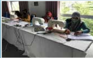
Peserta bengkel jahitan sedang fokus menjahit

PPWS Cawangan Kuching/Samarahan bekerjasama dengan Pusat Latihan Kraftangan Epal mengadakan bengkel jahitan membuat mini sejadah bertempat di Aras 2, Ibu Pejabat PPWS. Program ini disertai seramai 10 orang ahli.