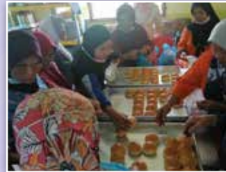
Kelas membuat bun anjuran PPWS Daerah Bekenu di rumah PPWS Bekenu