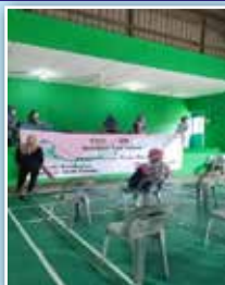
Persiapan sedang dilakukan oleh ahli-ahli PPWS sehari sebelum program dijalankan

Perkumpulan Kampung Sileng Melayu dengan kerjasama Kementerian Kesihatan Daerah Lundu mengadakan Program Pap Smear dan Pemeriksaan Payudara di Dewan Masyarakat Kampung Sileng Melayu sempena Hari Kanser Sedunia.