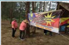
Pemasangan banner program sebelum memulakan aktiviti. Seramai 30 orang ahli menyertai program ini.

Program Santai dan Sukaneka PPWS Perkumumpulan Kampung Paon dan Perkumumpulan Sebat Baru Sematan sempena Sambutan Hari Merdeka.