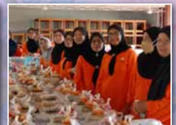
Aktiviti pengagihan bubur kepada penduduk setempat anjuran PPWS Perkumpulan Kampung Pejuang Kelulut