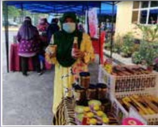
Antara gerai jualan yang ada dibuka di pekarangan bangunan PPWS Bintulu Tatau