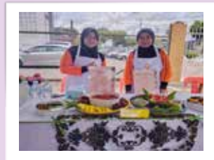
Peserta dari PPWS Daerah Mukah yang telah mendapat tempat Johan