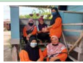
Perkumpulan Kampung Pusa 14 April 2022