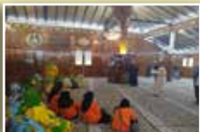
Rombongan telah disambut oleh Jawatankuasa Masjid dan ahli-ahli PPWS telah dikongsikan berkenaan sejarah Masjid Al-Qadim