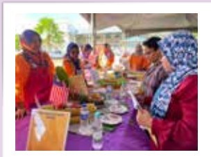
Para juri sedang menilai menu yang dipertandingkan oleh peserta