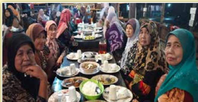
Ahli-ahli PPWS yang turut serta dalam Jamuan Makan Malam Santai Bersama Jawatankuasa Induk PPWS