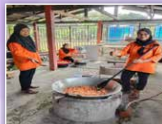
Ahli PPWS Perkumpulan Kampung Pejuang Kelulut bergotong-royong menyediakan juadah untuk diagihkan kepada penduduk setempat