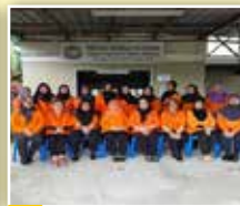
Gambar kenangan Jawatankuasa Induk PPWS bersama Jawatankuasa Perkumpulan Bandar Baru Tanjung Manis di rumah PPWS di Tanjung Manis