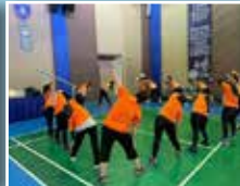
Aktiviti senaman untuk memanaskan badan sebelum acara pertandingan badminton bermula