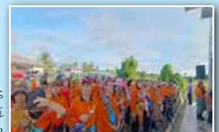
Ahli-ahli PPWS berkumpul beramai-ramai sebelum program bermula