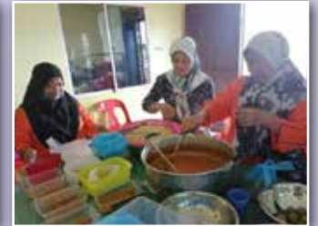
Kelas membuat Mee Kari anjuran PPWS Daerah Bekenu di rumah PPWS Bekenu