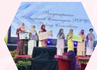
Anugerah Cawangan Cemerlang disampaikan oleh Isteri Premier Sarawak kepada PPWS Cawangan Sibul/Sarikei/Kapit