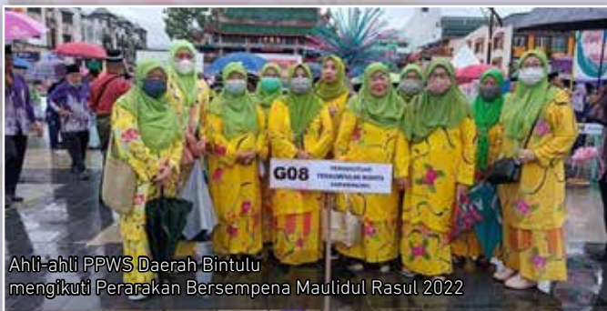
Ahli-ahli PPWS Daerah Bintulu mengikuti Perarakan Bersempena Maulidul Rasul 2022