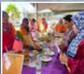
Para juri sedang menilai menu yang dipertandingkan oleh peserta