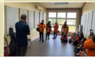
Ahli-ahli PPWS dibawa melihat ruangan aktiviti di kompleks tersebut