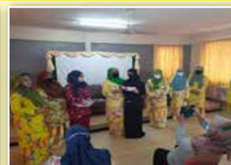
Sumbangan kepada salah seorang orang kurang berkemampuan

PPWS Daerah Sibu telah mengadakan Program Sumbangan Raya kepada Anak -Anak Yatim Dan Orang Kurang Berkemampuan. Program ini diadakan setahun sekali pada bulan Ramadan bertujuan membantu mereka yang kurang berkemampuan untuk dapat membeli persiapan hari raya. Penyerahan sumbangan diadakan di Bangunan PPWS Bahagian Sibu/Sarikei/Kapit.