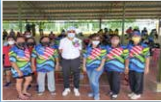
Tetamu Kehormat bersama Jawatankuasa Pengelola Pertandingan