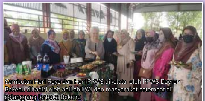
Sambutan Hari Raya dan Hari PPWS dikelola oleh PPWS Daerah Bekenu dihadiri oleh ahli ahli W.I dan masyarakat setempat di gelanggang terbuka Bekenu