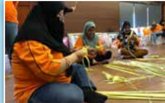
Acara Pertandingan Mengayam Ketupat turut diadakan dengan menilai siapa yang paling banyak mengayam ketupat mengikut masa yang ditetapkan

Program Ramah Mesra PPWS telah diadakan bertempat di Borneo Keranji Farm, Bau. Seramai 30 orang ahli dari semua Daerah dalam PPWS Cawangan Kuching/Samarahan telah menyertai program ini. Aktiviti sukaneka dan Majlis Makan Malam ialah program utama.