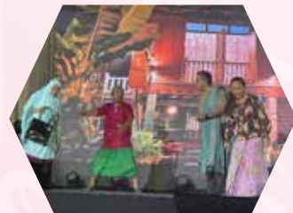
Sketsa PPWS berkenaan peranan PPWS sejak awal penubuhannya sehingga kini telah dipersembahkan oleh Persatuan Teater Ngangcong