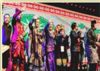
Penari-penari Borneo Cultural Festival yang menyertai program ini