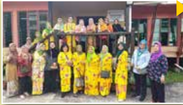
Lawatan Ke Kampung Rejang Tenun Songket