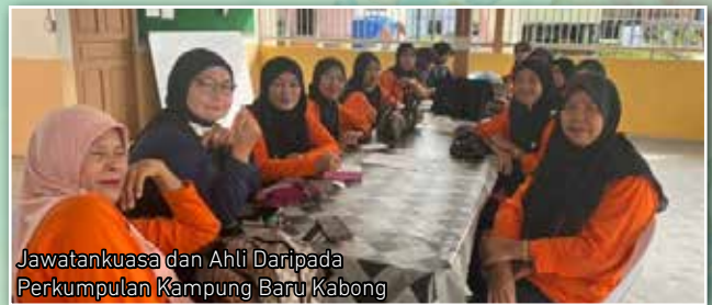
Jawatankuasa dan Ahli Daripada Perkumpulan Kampung Baru Kabong