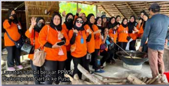
Lawatan sambil belajar PPWS Perkumpulan Gartak ke Pusa