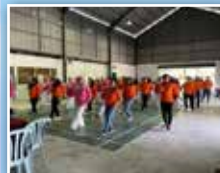
Senam aerobik beramai-ramai sebelum program ceramah bermula