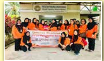
Rombongan melawat ke Rumah PPWS Bandar Baru Tanjung Manis disambut oleh Timbalan Pengerusi Perkumpulan Bandar Baru Tanjung Manis

Rombongan dari Perkumpulan Lutong, Miri utuk melawat ke Belawai, Jerijih, Rajang dan Bandar BaruTanjung Manis pada pagi tersebut telah disambut oleh ahli-ahli PPWS Daerah Sarikei serta semua Pengerusi-Pengerusi Perkumpulan dari Rajang, Belawai, Bandar Baru Tanjung Manis dan Jerijih. Tempat lawatan lain yang turut dilawat ialah Pusat Tenun Songket, Pembuatan Kuih Tradisional dan Rumah PPWS di Bandar Baru Tanjung Manis