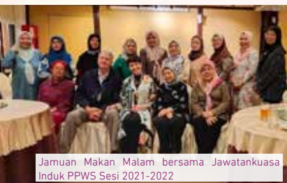
Jamuan Makan Malam bersama Jawatankuasa Induk PPWS Sesi 2021-2022