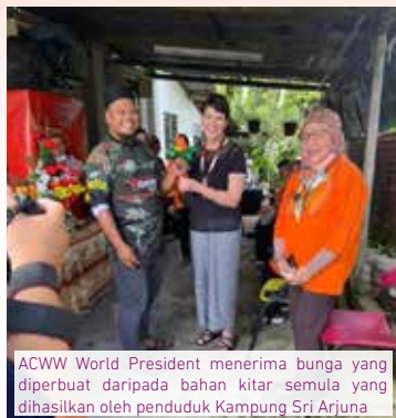
ACWW World President menerima bunga yang diperbuat daripada bahan kitar semula yang dihasilkan oleh penduduk Kampung Sri Arjuna