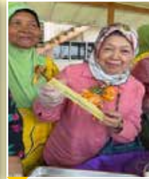
Pengerusi Negeri PPWS selesai mencuba membuat suman sambil diajar oleh salah seorang ahli Perkumpulan Belawai