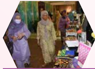
Booth PPWS turut dibuka untuk mempamerkan buku-buku terbitan PPWS dan produk yang dihasilkan ahli-ahli PPWS seluruh Sarawak