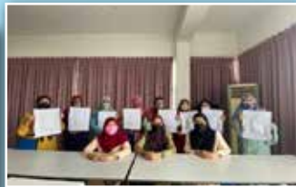
Setiap peserta menunjukkan hasil mini sejadah yang telah dipelajari