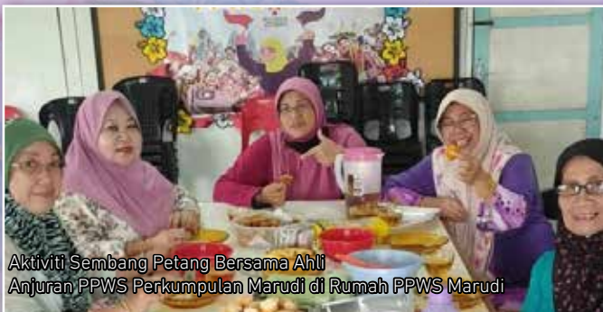
Aktiviti Sembang Petang Bersama Ahli Anjuran PPWS Perkumpulan Marudi di Rumah PPWS Marudi