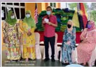
PPWS Daerah Bintulu / Tatau telah membuat Flagoff program Infak Ramadan yang telah dirasmikan oleh YB Datuk Talib Zulpilih dan isteri di Bangunan PPWS Bintulu