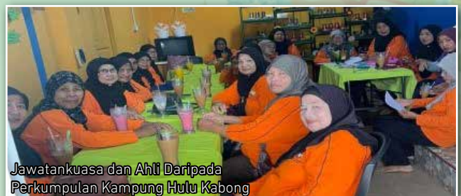
Jawatankuasa dan Ahli Daripada Perkumpulan Kampung Hulu Kabong