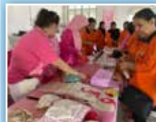
Jualan produk serta demonstrasi dari Pink Ribbon Support Group Kuching

Program ini juga diadakan di 3 buah daerah PPWS lain iaitu Daerah Serian pada 15 Oktober 2022, Daerah Bau pada 22 Oktober 2022 dan Daerah Sebuyau pada 29 Oktober 2022.