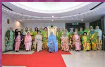
Ketibaan KDYMM Tuanku Permaisuri Agong di lobi hotel