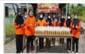
Perkumpulan Kampung Pangkat 9 April 2022