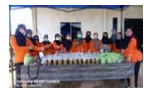
Perkumpulan Kampung Baru dan Perkumpulan Kampung Tengah Betong 15 April 2022