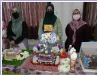
Para Peserta pertandingan Kek Lapis Premium