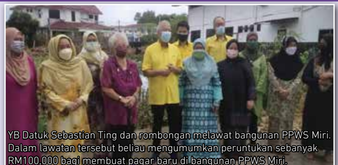
YB Datuk Sebastian Ting dan rombongan melawat bangunan PPWS Miri. Dalam lawatan tersebut beliau mengumumkan peruntukan sebanyak RM100,000 bagi membuat pagar baru di bangunan PPWS Miri.