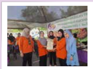
Salah seorang penerima hadiah Saguhati pertandingan