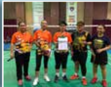
Ahli PPWS Daerah Kuching bersama ahli Kelab Badminton Pulapol