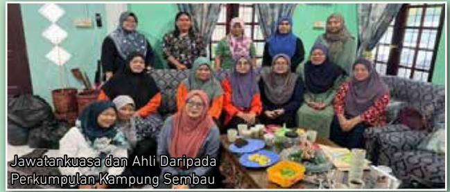
Jawatankuasa dan Ahli Daripada Perkumpulan Kampung Sembau