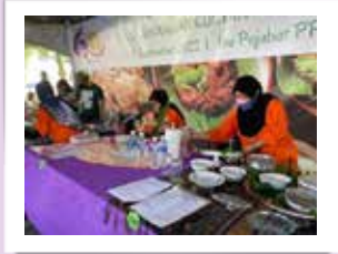
Peserta daripada Perkumpulan Sri Arjuna sedang membuat persiapan untuk menghias menu yang dipertandingkan

PPWS Cawangan Kuching / Samarahan menganjurkan pertandingan masakan ini pada 17 September 2022 di perkarangan Ibu Pejabat PPWS, Kuching. Program ini telah dirasmikan oleh Puan Hajah Zainab Tambi, Timbalan Pengerusi PPWS. Aktiviti ini telah diadakan di Perkarangan Ibu Pejabat PPWS, Kuching.