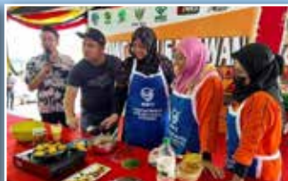
Demonstrasi masakan sedang dibuat sambil diperhatikan oleh tetamu yang hadir